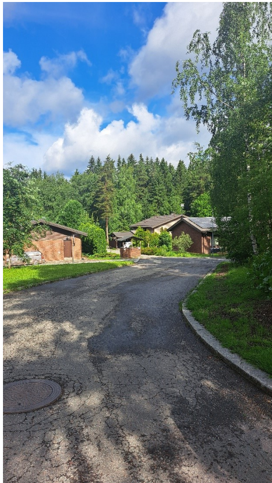
Kuva 3. Lähialueen rakennuskantaa