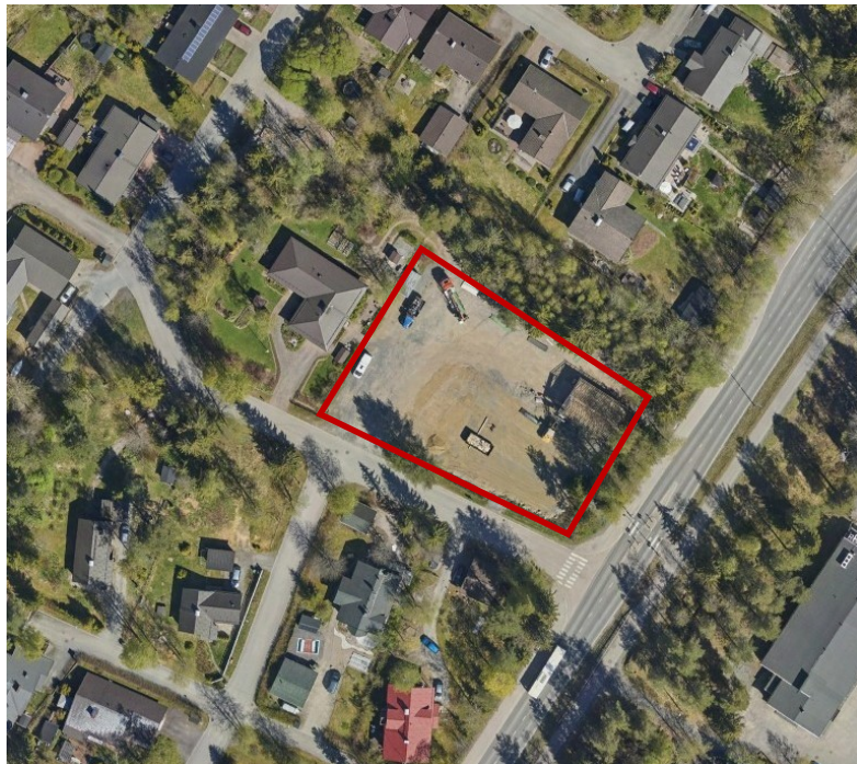
Kuva 4. Ilmakuva suunnittelualueesta vuodelta 2022. Tontti on tällä hetkellä rakentamaton.

Aitolahdentien toisella puolella sijaitsee Atalan liikekeskus ja alakoulu sekä päiväkotiki. Koilliskeskukseen on matkaa noin 2 km.