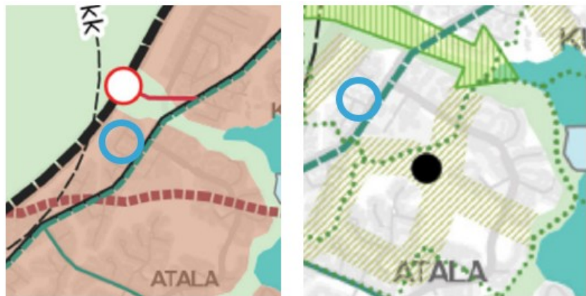
Kuva 5. Ote kantakaupungin yleiskaavayhdistelmästä. Vasemmalla kartta 1, yhdyskuntarakenne. Oikealla kartta 2, viherympäristö ja vapaa-ajan palvelut

Alue on Näsijärven valuma-aluetta sekä melu- ja ilmanlaatuselvitystarpeen harkinta-aluetta.