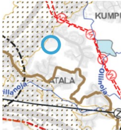
Kuva 6. Ote kantakaupungin yleiskaavayhdistelmästä. Kartta 4, kestävä vesitalous, ympäristöterveys ja yhdyskuntatekninen huolto