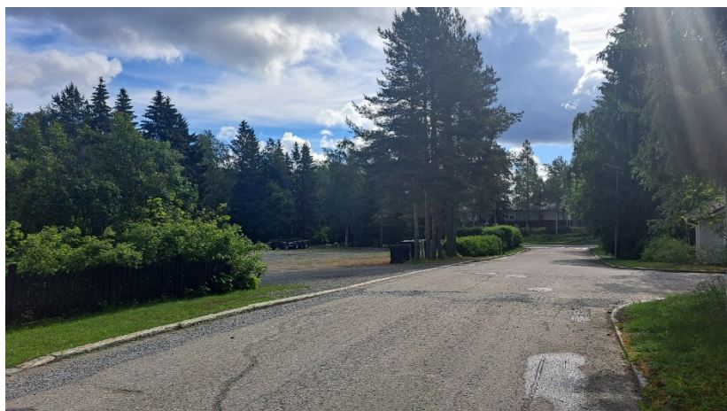
Kuva 1. Näkymä Lautakatonkadulta. Muutostontti vasemmalla.

Tontti on liitetty kunnalliseen vesi- ja viemäriverkkoon.