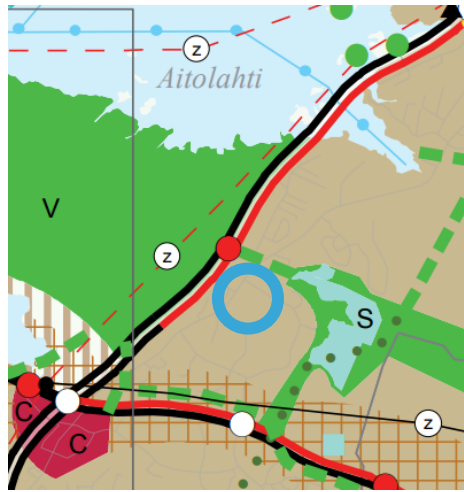
Kuva 4. Ote maakuntakaavasta 2040