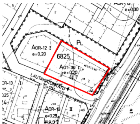
Kuva 7. Ajantasa-asemakaava nro 5333.

Suunnittelualueella on voimassa 13.3.1980 vahvistettu asemakaava numero 5333. Asemakaavassa tontti on merkitty omakotirakennusten korttelialueeksi, jolle saadaan rakentaa autosäilytys- ja huoltotilaa kuitenkin enintään 30 % kerrosalan määrästä (AOT-30). Kerroslukuna on I, ja tonttitehokkuus e = 0,20 .