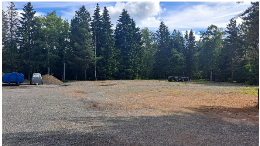
Kuva 2. Tontti on rakentamaton.